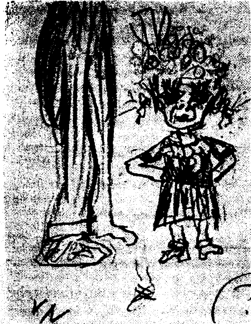
تصویر از Annotated Lolita اثر آلفرد اهل

۲۵.۵ بیت شعری من در آوردی که بازتابنده‌ی اشعار شاعران رمانتیک فرانسه است، کسانی مانند آلفرد دو موسه.